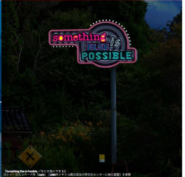
『Something Else is Possible / なにか他にできる』 エレン・ネスコポード作 (cast) [1990年オキナワ国立自治大学文化センターに永久設置] を参照