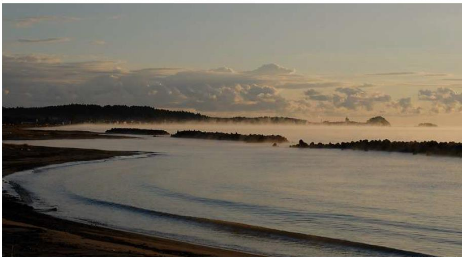
※イットとびつと写真ライブラリー会場

第一回2023年10月6日(金)・第二回2023年10月8日(日)・第三回2023年10月15日(日)