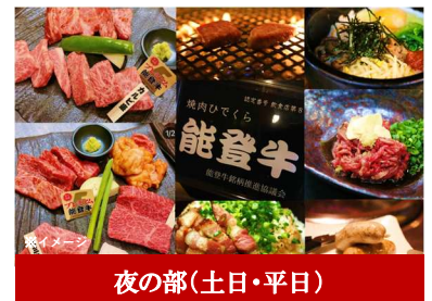
夜の部(土日・平日)

能登牛プレミアムと 厳選能登野菜コラボランチ ※全10種、おひとりずつお選び頂けます。 ※ドリンク別途料金